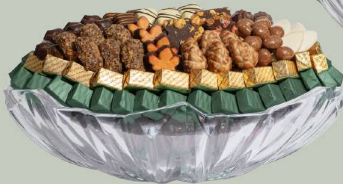
Ref0030 Coupe Cristal ovale L= 36 cm l = 23 cm H= 12 cm 1500 g - 2 900 MAD