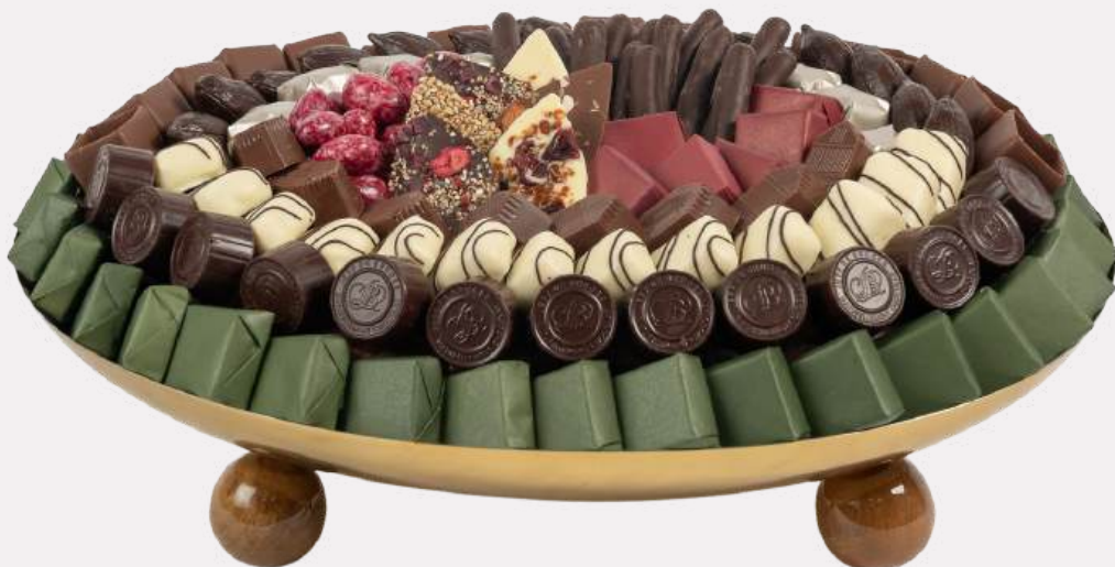
Ref0048 Coupe Inox ovale pieds bois PM L= 30 cm l= 25 cm H= 8 cm 1200 g - 1 750 MAD