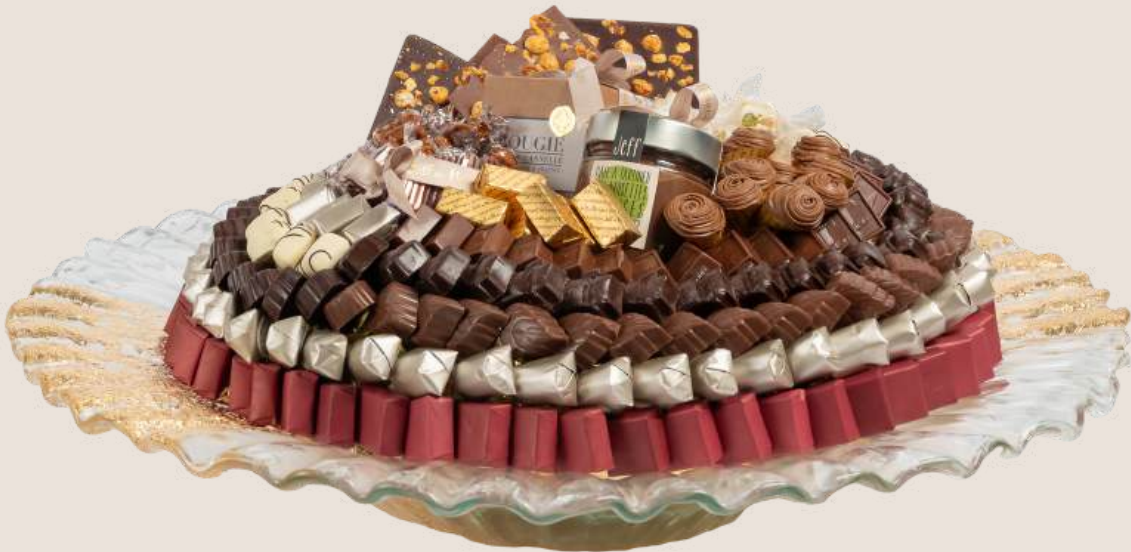
Ref0034 Centre de table Murano PM Ø = 44 cm H= 12 cm 2000 g - 2 880 MAD