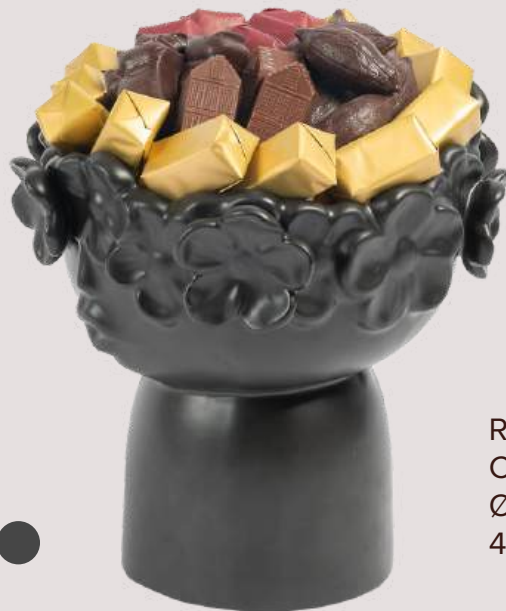
Ref0092 Coupe bord fleurs Ø= 16 cm H= 16 cm 400 g - 680 MAD