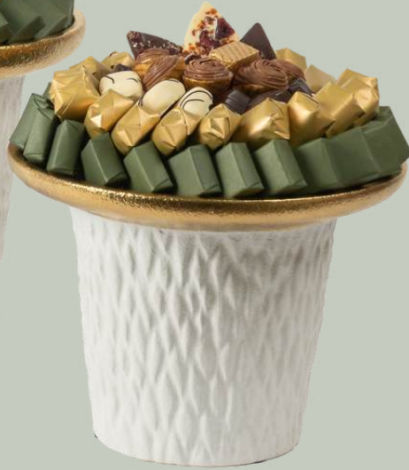
Ref0006 C ramique white gold GM   = 26 cm H=24 cm 950 g - 1480 MAD