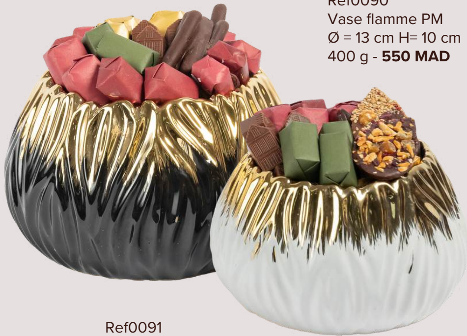
Ref0090 Vase flamme PM Ø = 13 cm H= 10 cm 400 g - 550 MAD