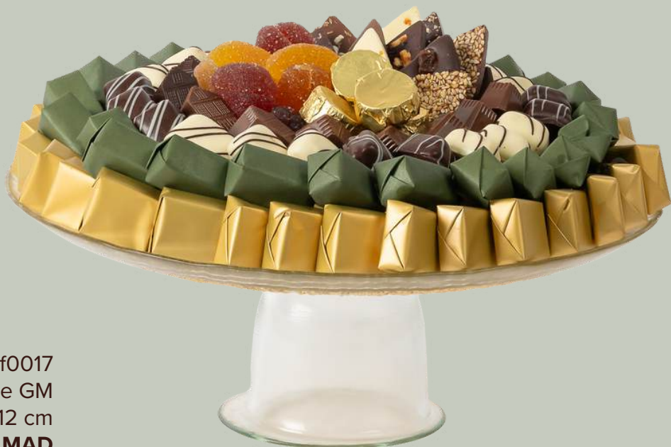
Ref0017 Plat à tarte en verre GM Ø = 32 cm H= 12 cm 1500 g - 1 780 MAD