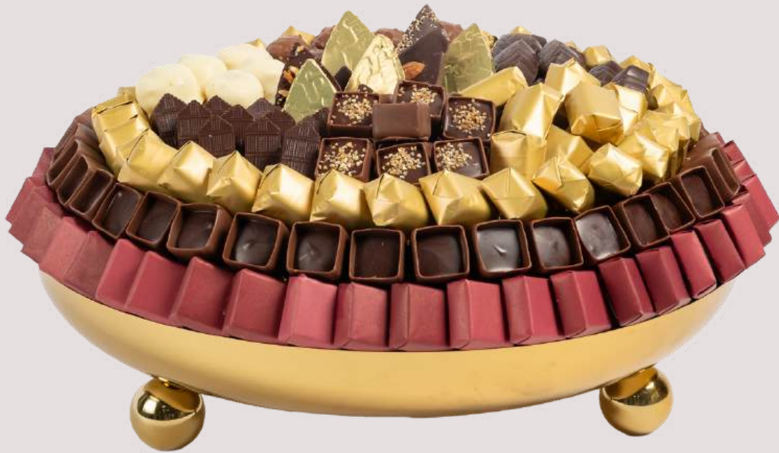
Ref0085 Corbeille Inox pieds boules L= 38cm l = 38 cm H= 10 cm 2000 g - 2 760 MAD