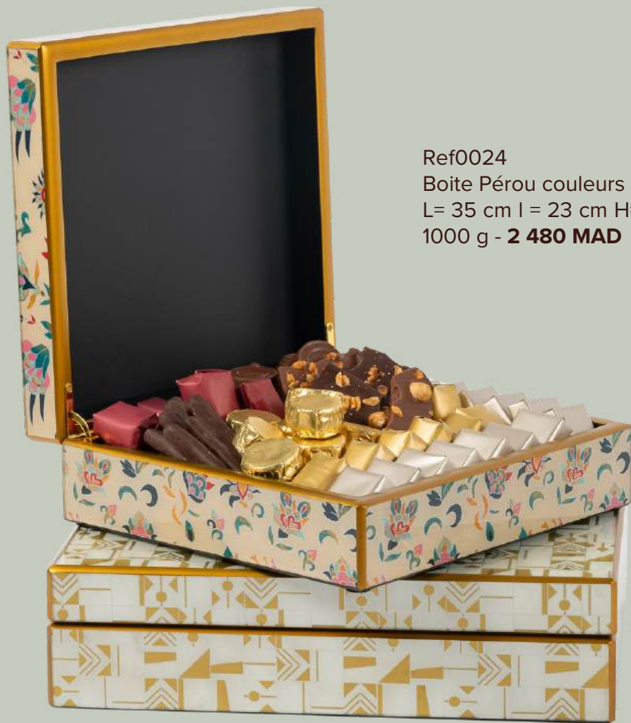
Ref0024 Boite Pérou couleurs L= 35 cm l = 23 cm H= 8 cm 1000 g - 2 480 MAD