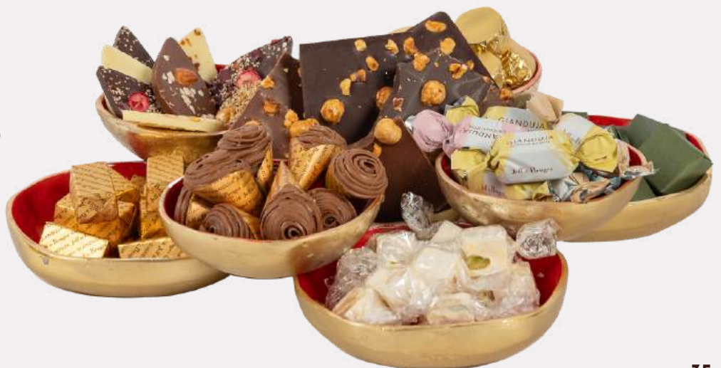
Ref0053 Serviteur 9 compartiments L= 36 cm l = 36 cm H= 6 cm 1000 g - 1 280 MAD