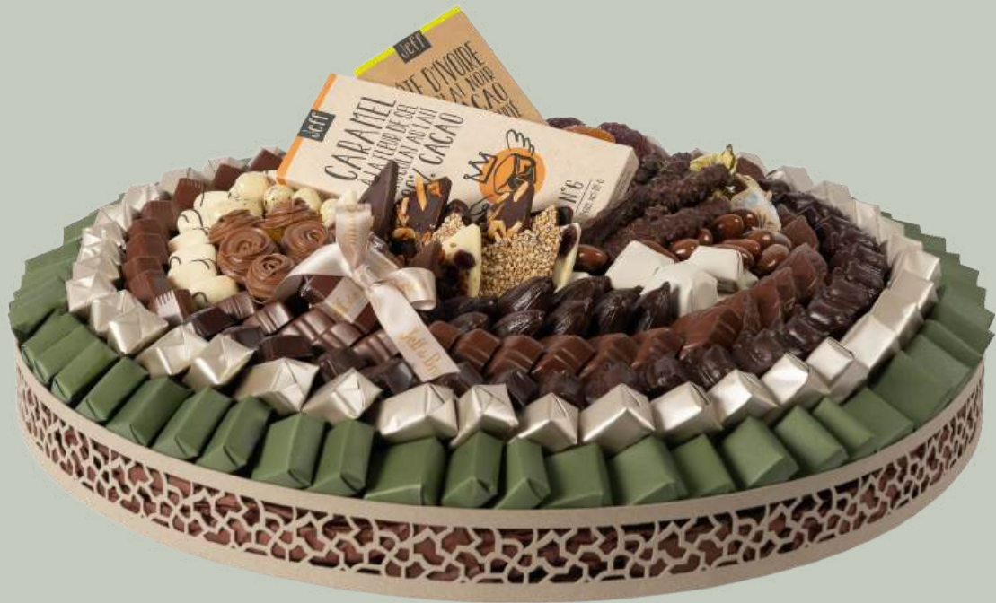
Ref0012 Plateau rond galvanise Piasseti PM Ø = 40 cm H = 8 cm 1800 g - 2 750 MAD