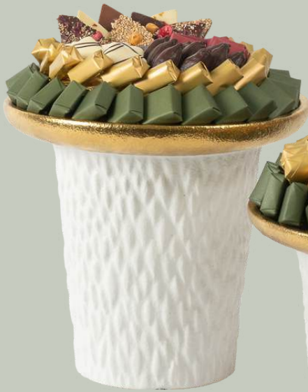
Ref0005 C ramique white gold PM   = 24 cm H= 18 cm 750 g - 1 280 MAD