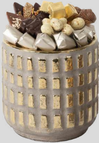
Ref0069 Vase carreaux vintage GM Ø= 15 cm H= 16 cm 400 g - 590 MAD