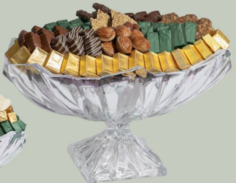
Ref0031 Coupe Cristal ovale sur pied L= 36 cm l = 23 cm H= 22 cm 1500 g - 3 300 MAD