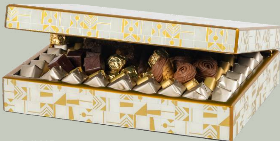
Ref0025 Boite Pérou blanche L= 35 cm l = 23 cm H= 8 cm 1500 g - 3 680 MAD