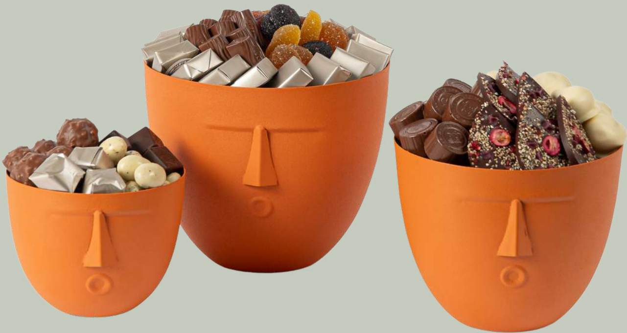
Ref0020 Pot tête PM Ø = 12 cm H= 10 cm 250 g - 320 MAD