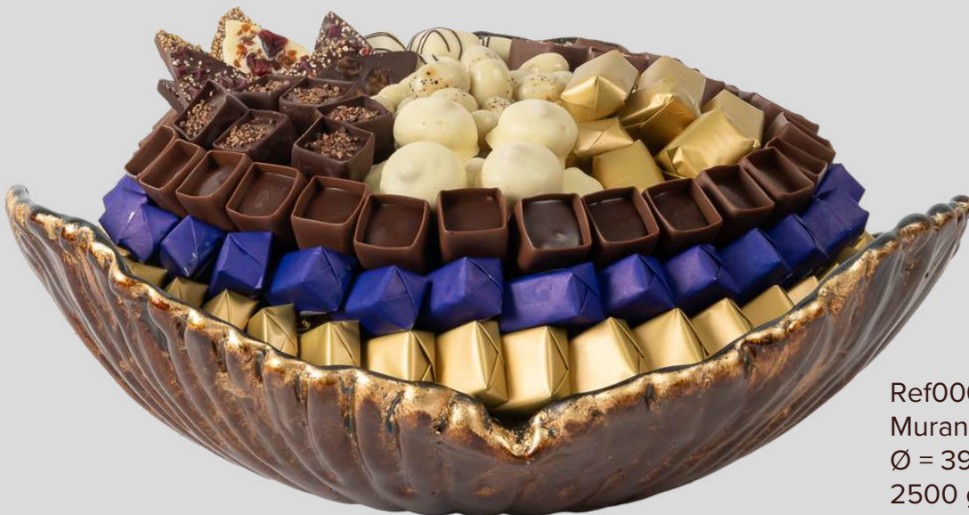
Ref0066 Murano gold blue GM Ø = 39 cm H = 20 cm 2500 g - 3380 MAD