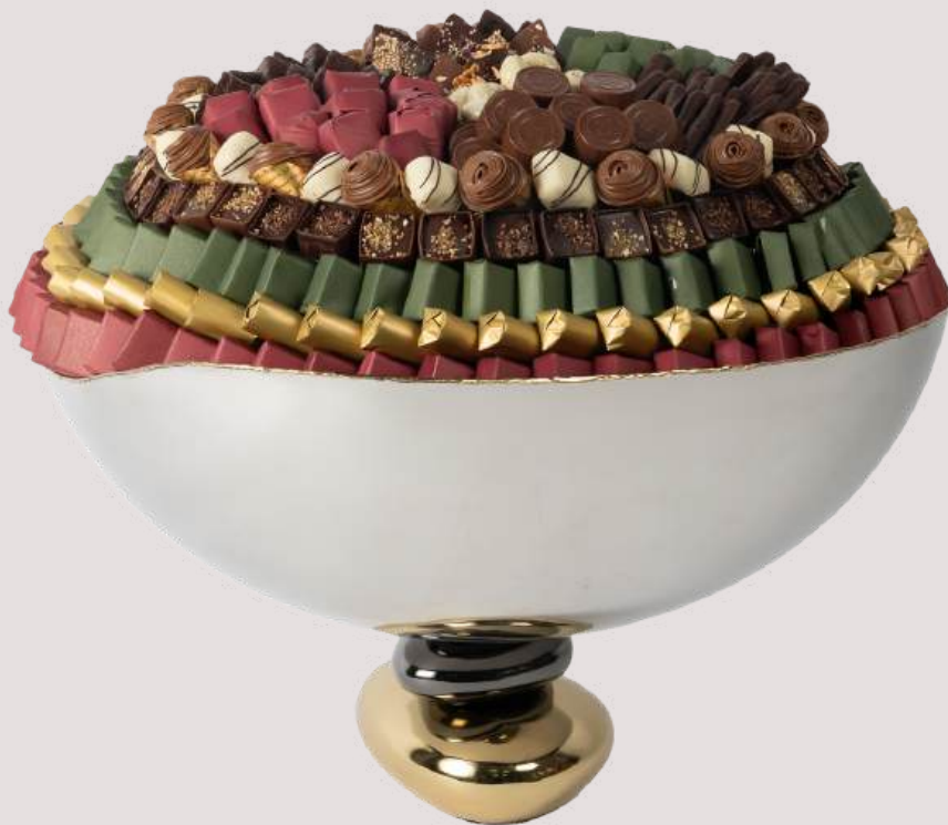
Ref0093 Coupe galet GM Ø = 50 cm H= 30 cm 4000 g - 9 350 MAD 5000 g - 9 950 MAD