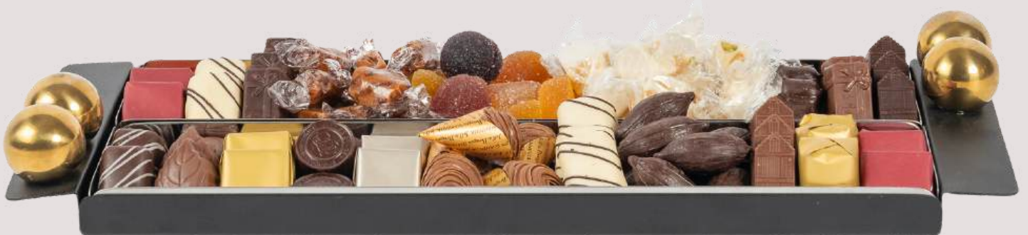
Ref0086 Plateau design 1 section L= 47 cm l = 9 cm H= 2 cm 500 g - 940 MAD