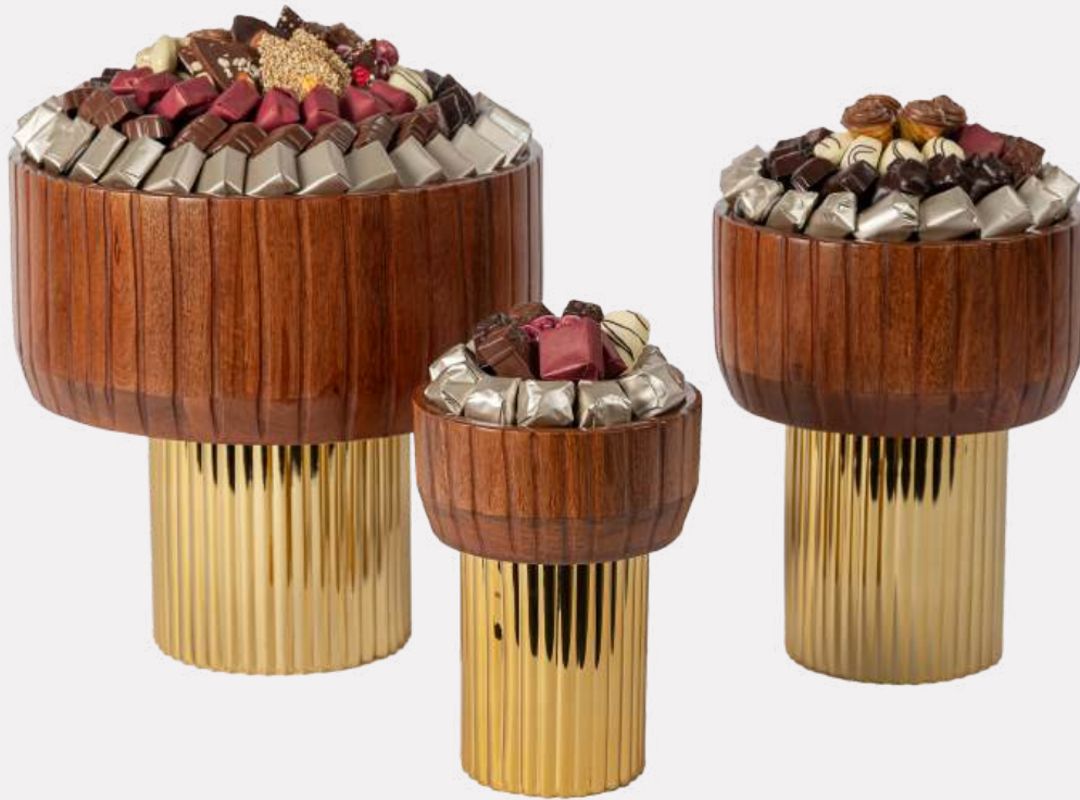
Ref0045 Coupe en bois sur pied PM Ø = 15 cm H= 21 cm 500 g - 980 MAD