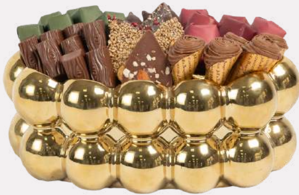
Ref0050 Boule ovale doré PM L= 22 cm l= 14 cm H= 10 cm 600 g - 780 MAD