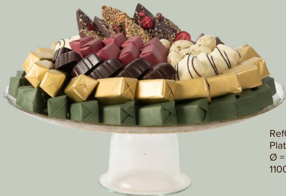
Ref0016 Plat à tarte en verre PM Ø = 28 cm H= 10 cm 1100 g - 1 380 MAD