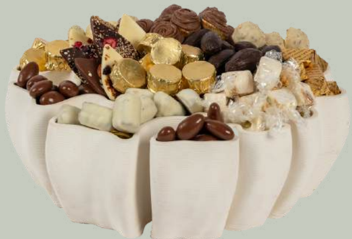
Ref0003 Coupe blanche fleurs L= 30 cm l= 30 cm H= 10 cm 1250 g - 1980 MAD