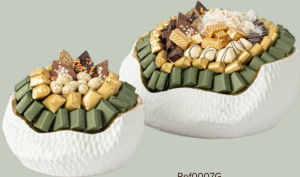
Ref0007G Coupe design GM   = 30 cm H= 14 cm 1350 g - 1 980 MAD