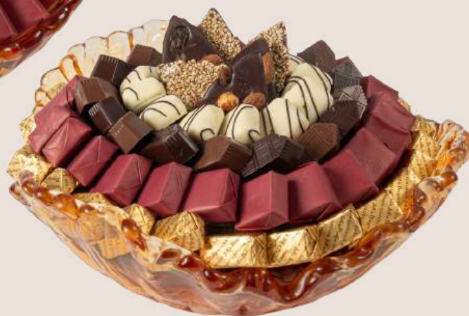
Ref0038 Corbeille Murano doré GM Ø = 40 cm H = 15 cm 2500 g - 3 380 MAD