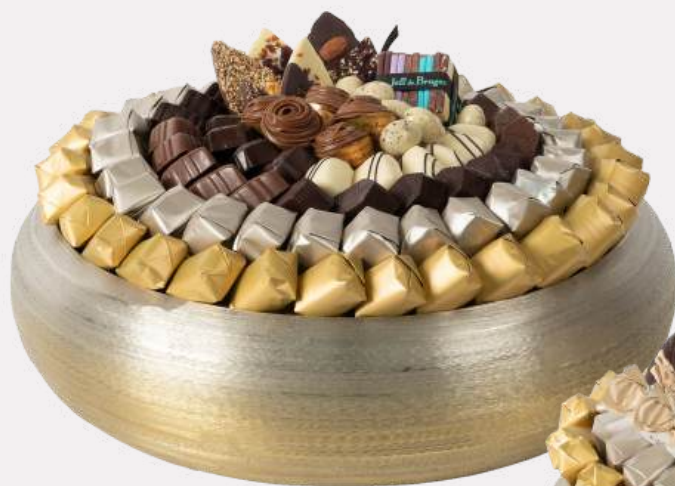
Ref0056 Coupe ronde métal brossé PM Ø = 25 cm H=9 cm 1250 g - 1 600 MAD