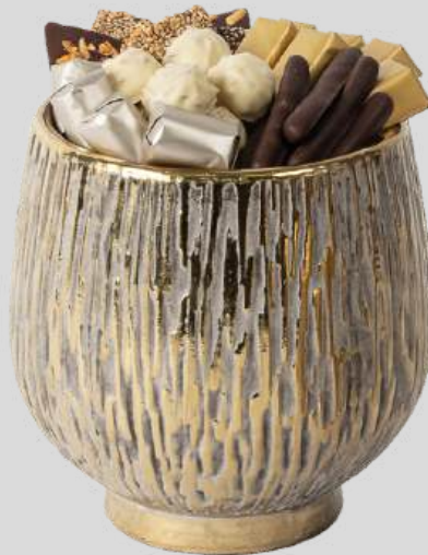
Ref0071 Vase céramique vintage GM Ø = 15 cm H= 16 cm 400 g - 590 MAD