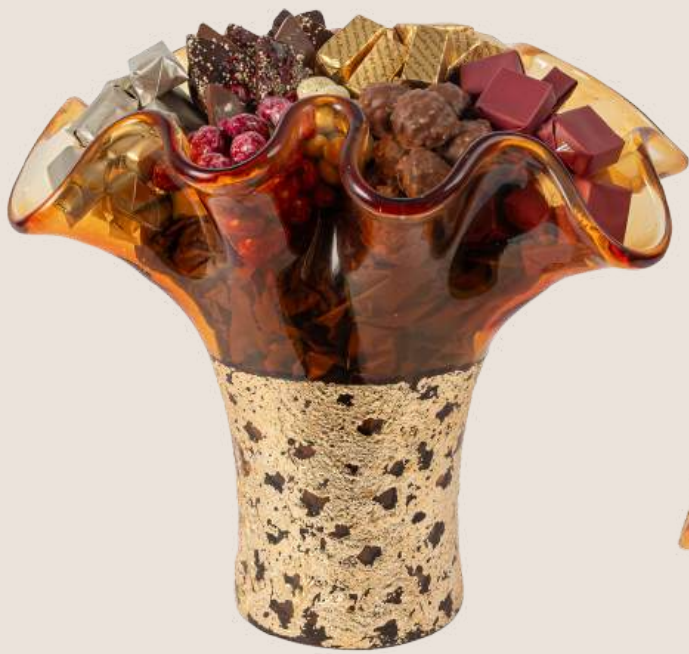
Ref0032 Vase Murano L= 29 cm l= 23 cm H= 30 cm 1150 g - 1 750 MAD