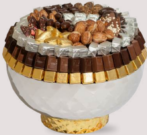
Ref0096 Coupe Inox pied gold PM Ø = 25 cm H= 13 cm 1000 g - 1 880 MAD