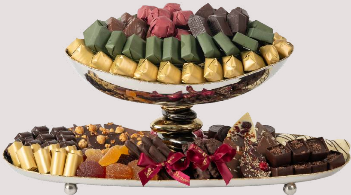
Ref0098 Coupe sur plateau inox L = 46 cm l = 20 cm H= 16 cm 2500 g - 4 350 MAD