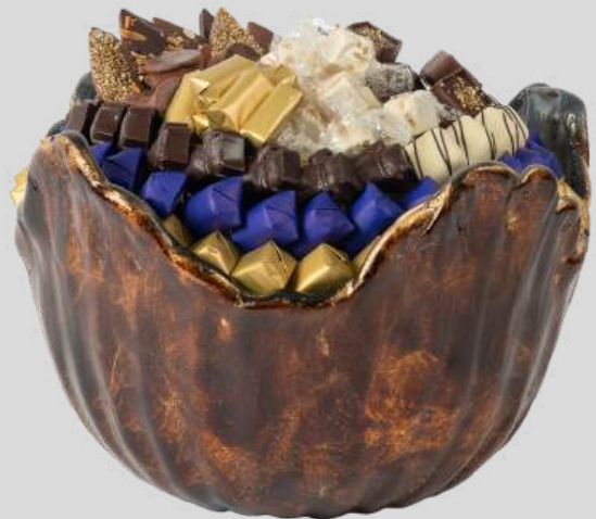
Ref0065 Corbeille Murano haute gold blue Ø = 30 cm H= 20 cm 2000 g - 2 680 MAD