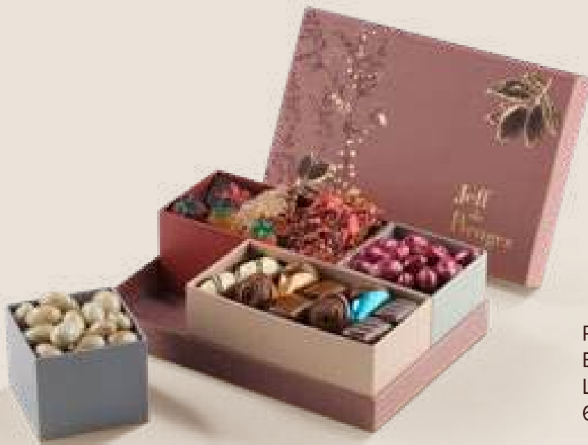
Ref0099 Boite Variopinto Multibloc L= 27 cm l= 27 cm H= 10 cm 650 g - 790 MAD