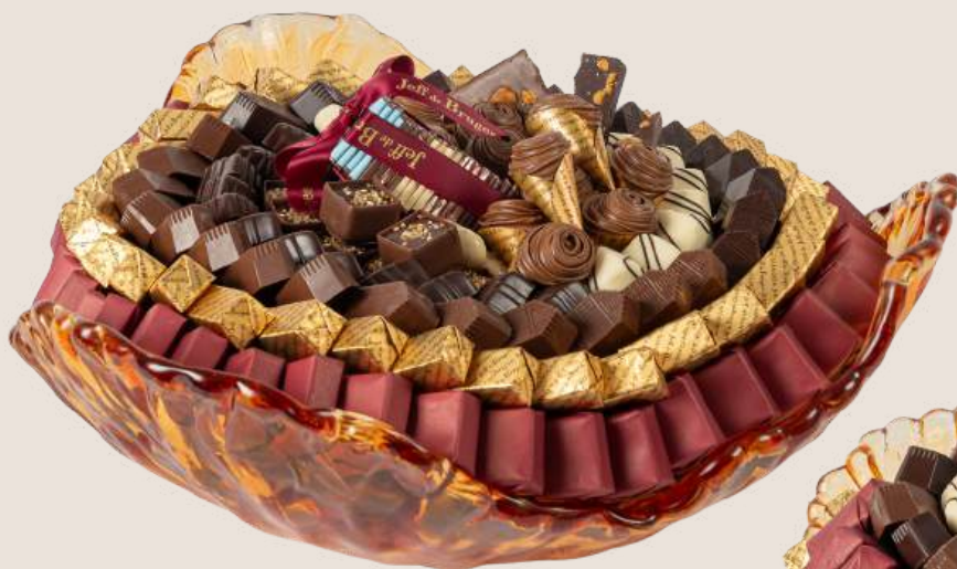
Ref0037 Corbeille Murano doré PM Ø = 28 cm H= 20 cm 1000 g - 1 580 MAD