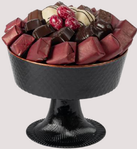
Ref0082 Coupe noire mate PM Ø = 16 cm H= 12 cm 350 g - 580 MAD