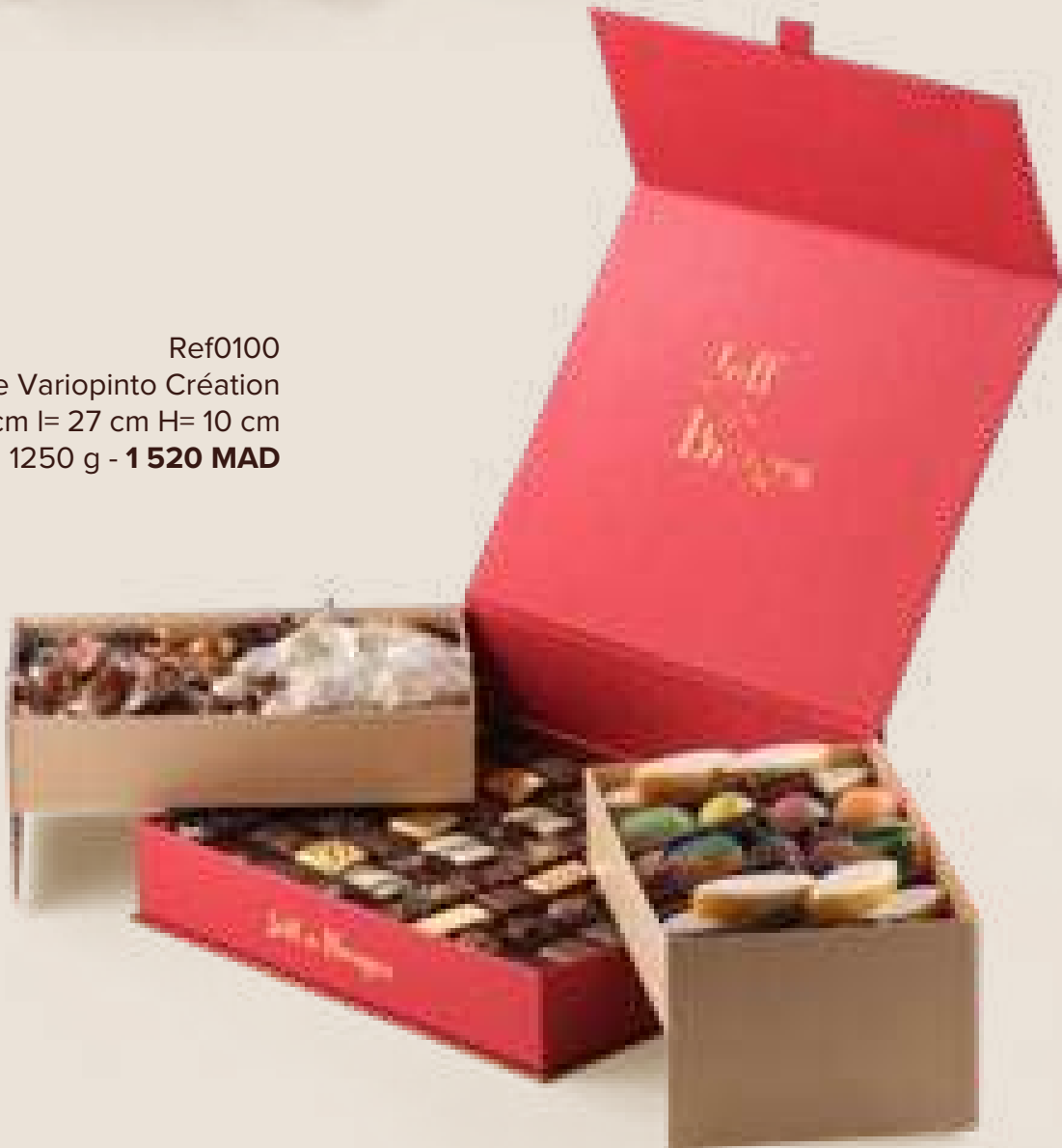
Ref0100 Boite Variopinto Création L= 22cm l= 27 cm H= 10 cm 1250 g - 1 520 MAD