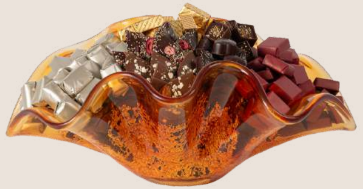
Ref0033 Coupe Murano L= 44 cm l= 29 cm H= 16 cm 2000 g - 2 850 MAD