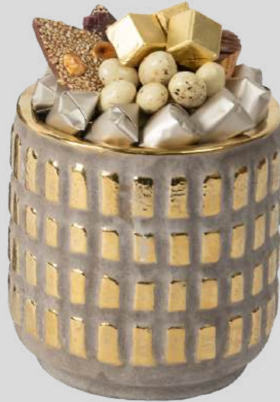
Ref0070 Vase carreaux vintage PM Ø = 13 cm H= 14 cm 300 g - 490 MAD