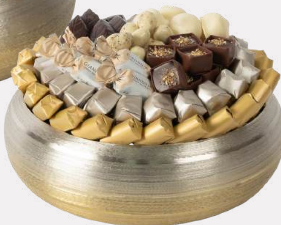
Ref0057 Coupe ronde métal brossé GM Ø = 30 cm H= 11 cm 1750 g - 2 300 MAD