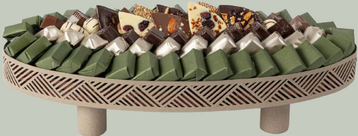
Ref0014 Plateau Piasseti PM L= 50 cm l= 25 cm H= 8 cm 1800 g - 2 650 MAD