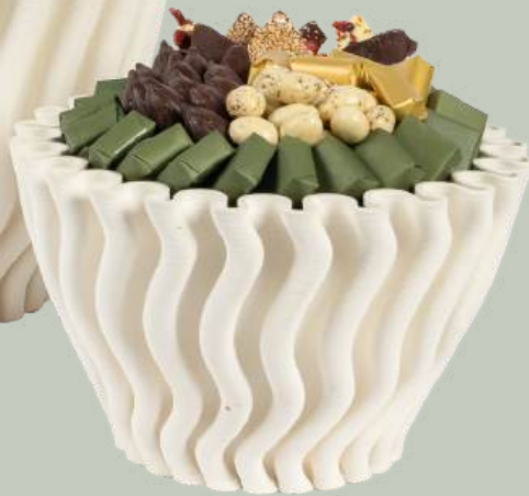
Ref0002 Pot plissé blanc GM Ø = 35 cm H=25 cm 1700 g - 3500 MAD