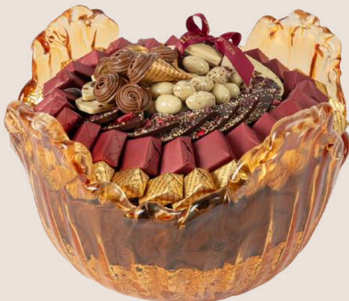
Ref0039 Corbeille Murano haute doré Ø = 32 cm H= 20 cm 2000 g - 2 680 MAD