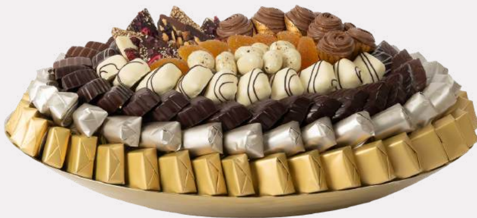
Ref0054 Coupe ovale métal brossé PM L= 38 cm l= 28 cm H= 5 cm 1800 g - 1 980 MAD