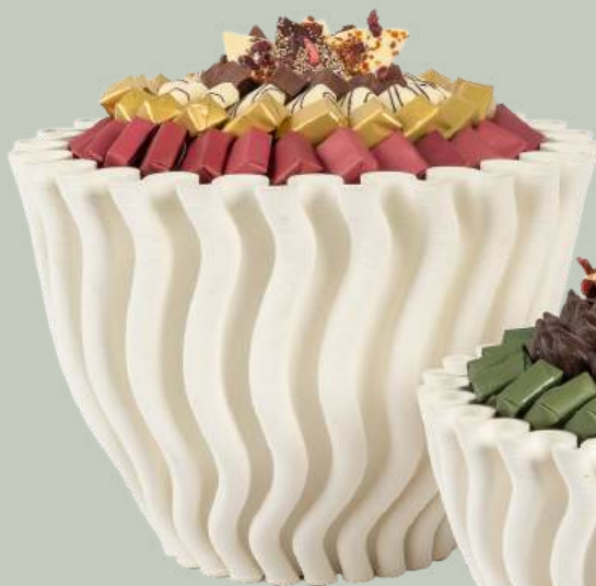
Ref0001 Pot plissé blanc PM Ø = 26 cm H= 16 cm 1500 g - 2500 MAD