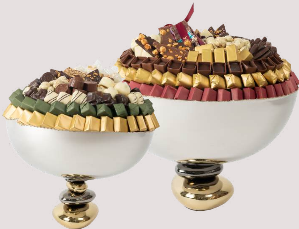
Ref0094 Coupe galet MM Ø = 40 cm H= 27 cm 3000 g - 6 450 MAD