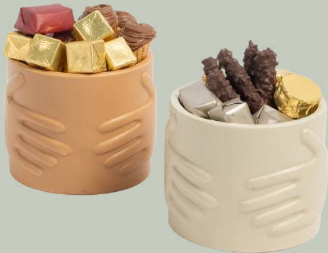
Ref0023 Pot Hands Ø = 10 cm H = 8 cm 200 g - 320 MAD