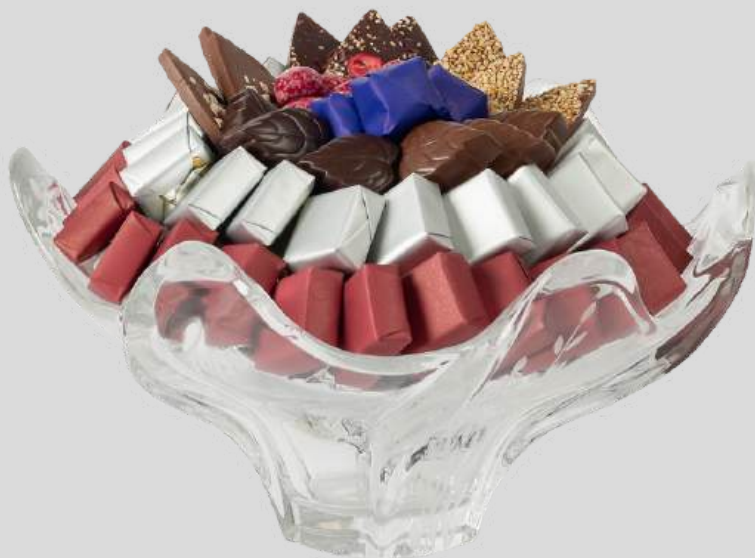
Ref0061 Coupe cristal PM Ø = 27 cm H= 17 cm 750 g - 1 250 MAD