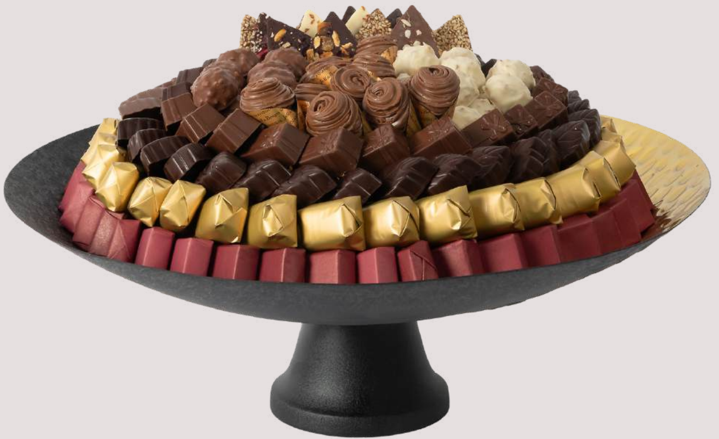
Ref0089 Coupe gold & black sur pied Ø = 50 cm H= 16 cm 3000 g - 3 590 MAD