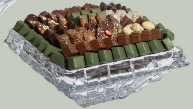
Ref0029 Coupe Cristal bohème L= 28 cm l = 28 cm H= 12 cm 1500 g - 2 900 MAD