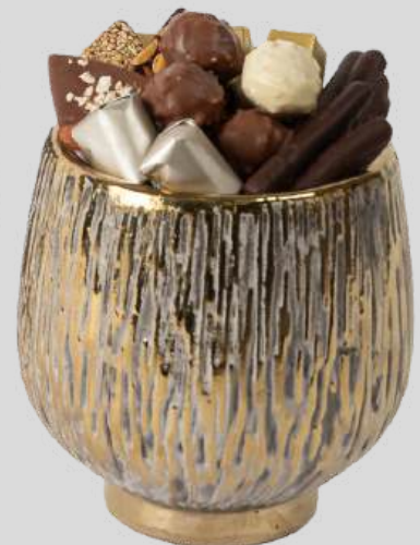
Ref0072 Vase céramique vintage PM Ø = 13 cm H= 14 cm 300 g - 490 MAD