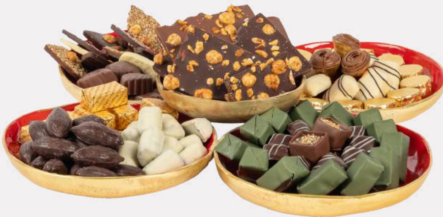
Ref0052 Serviteur 5 compartiments L= 36 cm l = 36 cm H= 6 cm 1200 g - 1 580 MAD