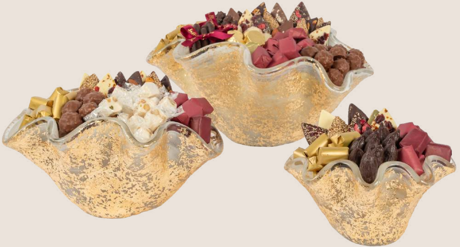
Ref0040 Coupe Murano dorée PM L= 21 cm l= 18 cm H= 10 cm 400 g - 850 MAD