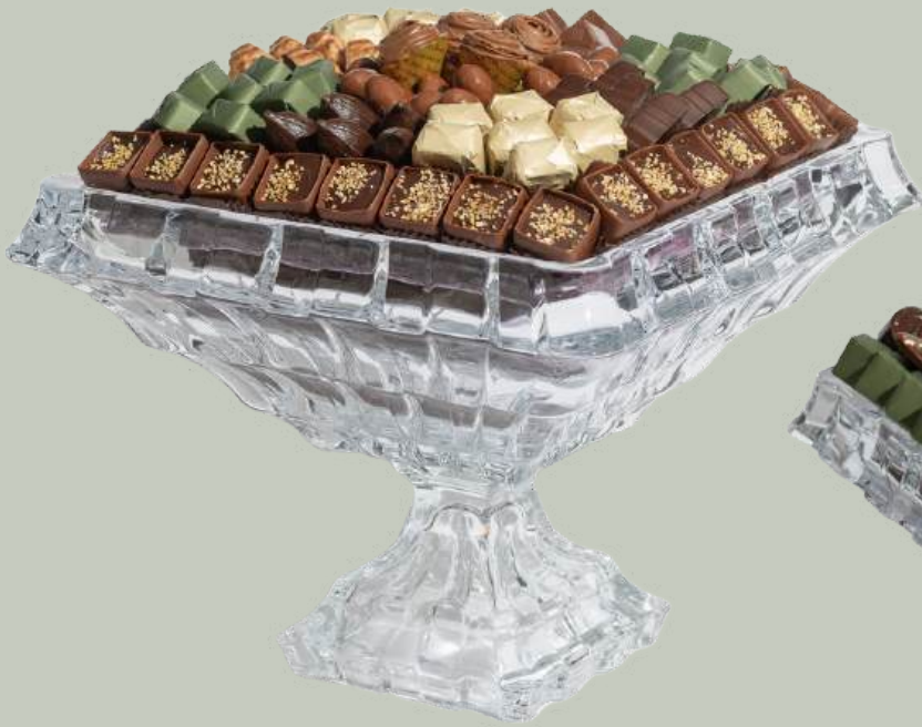
Ref0028 Coupe Cristal de bohème sur pied L= 28 cm l = 28 cm H= 22 cm 1500 g - 3 300 MAD