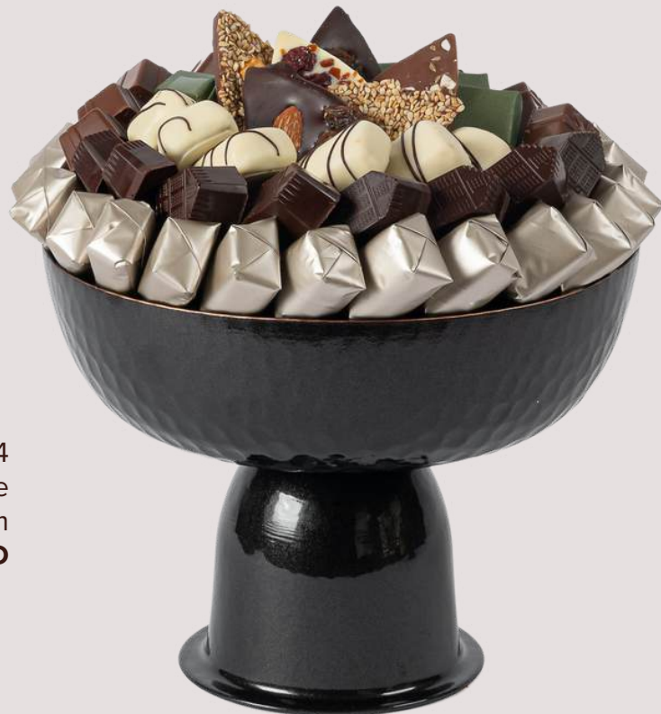
Ref0084 Coupe sur pied noire Ø = 21 cm H = 15 cm 750 g - 980 MAD